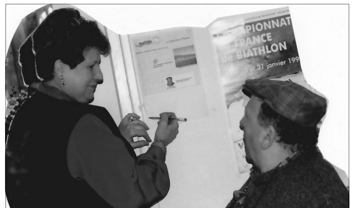
Monsieur Météo et Ginette

Il a été aussi Monsieur Météo lorsque j'avais le café de l'Ancolie. Chaque jour il donnait le temps à mettre sur le site de St Martin et savait lire les quatre temps.»